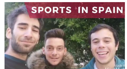
Sports in Spain