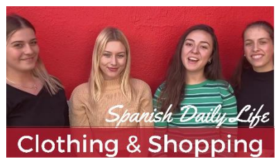
Clothing & Shopping in Spain