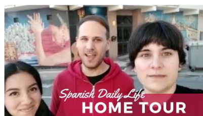
Spanish Home Tour