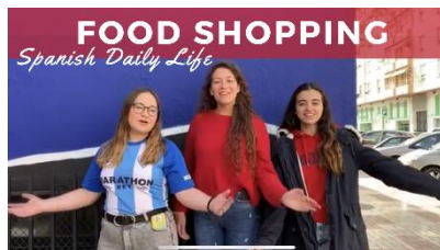
Food Shopping in Spain