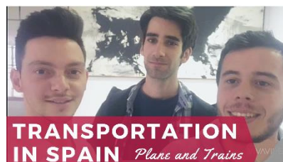
Transportation in Spain